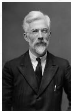
Sir Ronald Fisher, Statistician